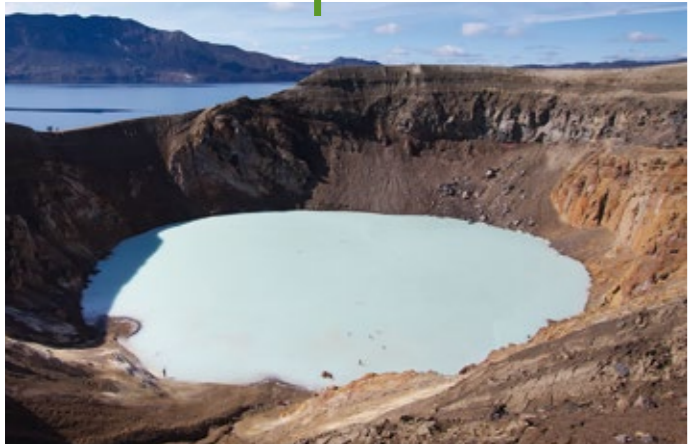
Viti-Maar, Island, Foto (cc): Henrik Thorburn