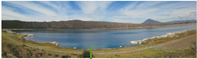
Alchichica-Maar in Mexiko